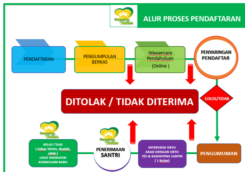
Gambar : Alur Proses Pendaftaran dan Seleksi Calon Santri

Kedua : Seleksi penentuan setelah lulus tahap pertama kemudian akan dipanggil bagi yang terpilih untuk mulai masuk kepesantren Bersama orang tua untuk melakukan Interview dan masa karantina/Pembetahan di Pesantren (1 minggu – 1 bulan) Jika lulus ditahap ini maka akan dinyatakan menjadi santri baru Pesantren Yatim Mabda Islam Sukabumi tahun 2020-2021. Untuk memudahkan pemahaman bisa dilihat pada gambar berikut ini :